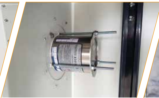
Aerosolgenerator zur Brandbekämpfung