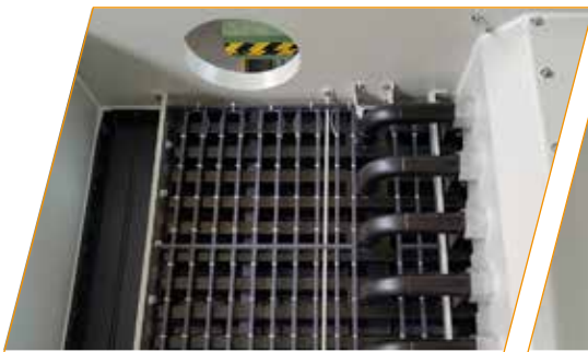
Wärmedetektion zur Branderkennung