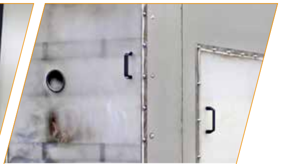
Aerosolausbreitung bei der Brandbekämpfung